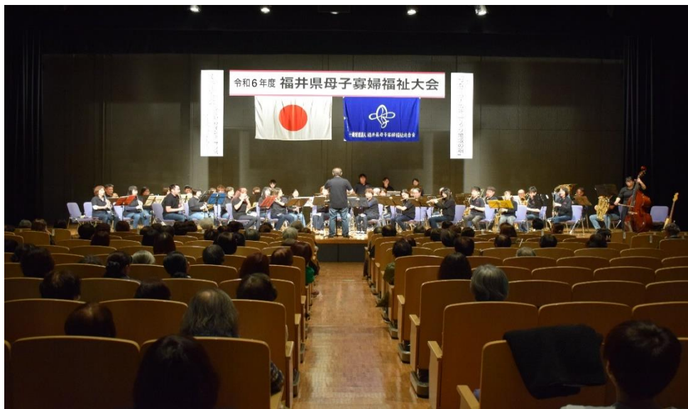
ふくい Wind Brass ミニ演奏会