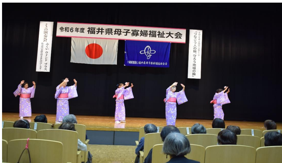
越前町 踊り 「うらら」